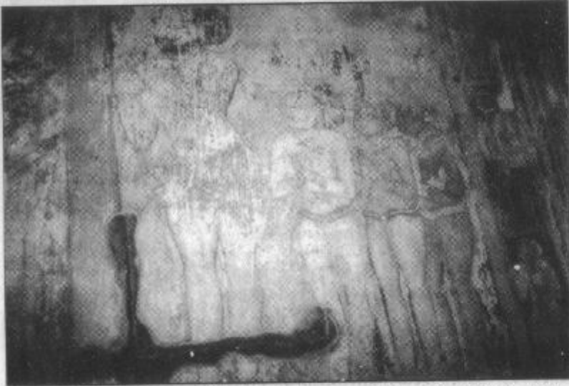
உடையார் ஸ்ரீ ராஜராஜத்தேவர் அவர் மனைவியர் தந்திசத்தி விடங்கி, வானதி, பஞ்சவன்மாதேவி (இது நாவலாசிரியரின் அனுமானம், சரித்திர ஆராய்ச்சியாளர்கள் உறுதி செய்யவில்லை.)

“வெற்றி வாகை சூடி வாருங்கள். இது உங்களுடைய மேன்மை யான நேரம் என்று ஜோதிடர்கள் சொல்கிறார்கள். அதே நேரம் சனி கிரகத்தால் கடுமையான வேலைப் பளுவும், சிந்தனை அதிகரிப்பும் இருக்கும் என்றும் சொன்னார்கள், நல்லத் தூக்கமும், படுக்கை சுகமும் கெடும் என்றும் சொன்னார்கள்.