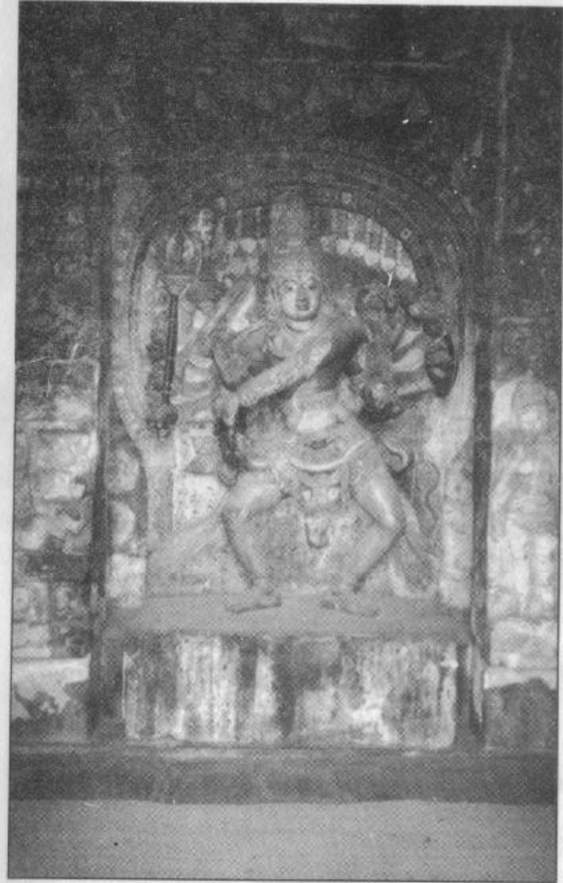
உள்ளே பிரகாரத்தில் இருக்கும் ஊழித் தாம்பவர்

ஸ்ரீ இராஜராஜர் எதில் இருப்பார். புதிதாகக் கண்டுபிடித்த அந்த நான்கு சக்கரத் தேரில் இருப்பாரா. ஆறு குதிரைகள் பூட்டிய நான்கு சக்கரத் தேரில் கால் ஊன்றி கணைகள் தொடுப்பாரா. எப்படியிருப்பார். நான் இராஜராஜரை யோசிக்கிறேன். நினைவாற்றலுக்கு உதாரணமாக கிருஷ்ணன்ராமனான பிரம்ம ராயரை யோசிக்கிறேன். அழகனும், வேகமுள்ளவனுமாக இராஜேந்திரரை முருகனாக யோசிக்கிறேன். பஞ்சவன்மாதேவி போயிருக்கிறார். அரசருக்கருகே துணையாக நிற்பார். வாள் ஏந்தி அடிப்பார். வேல்வீசி எறிவார். சோழதேசத்துப் பெண்மணி மேலைச்சாளுக்கியத்தில் எதிரிகளை