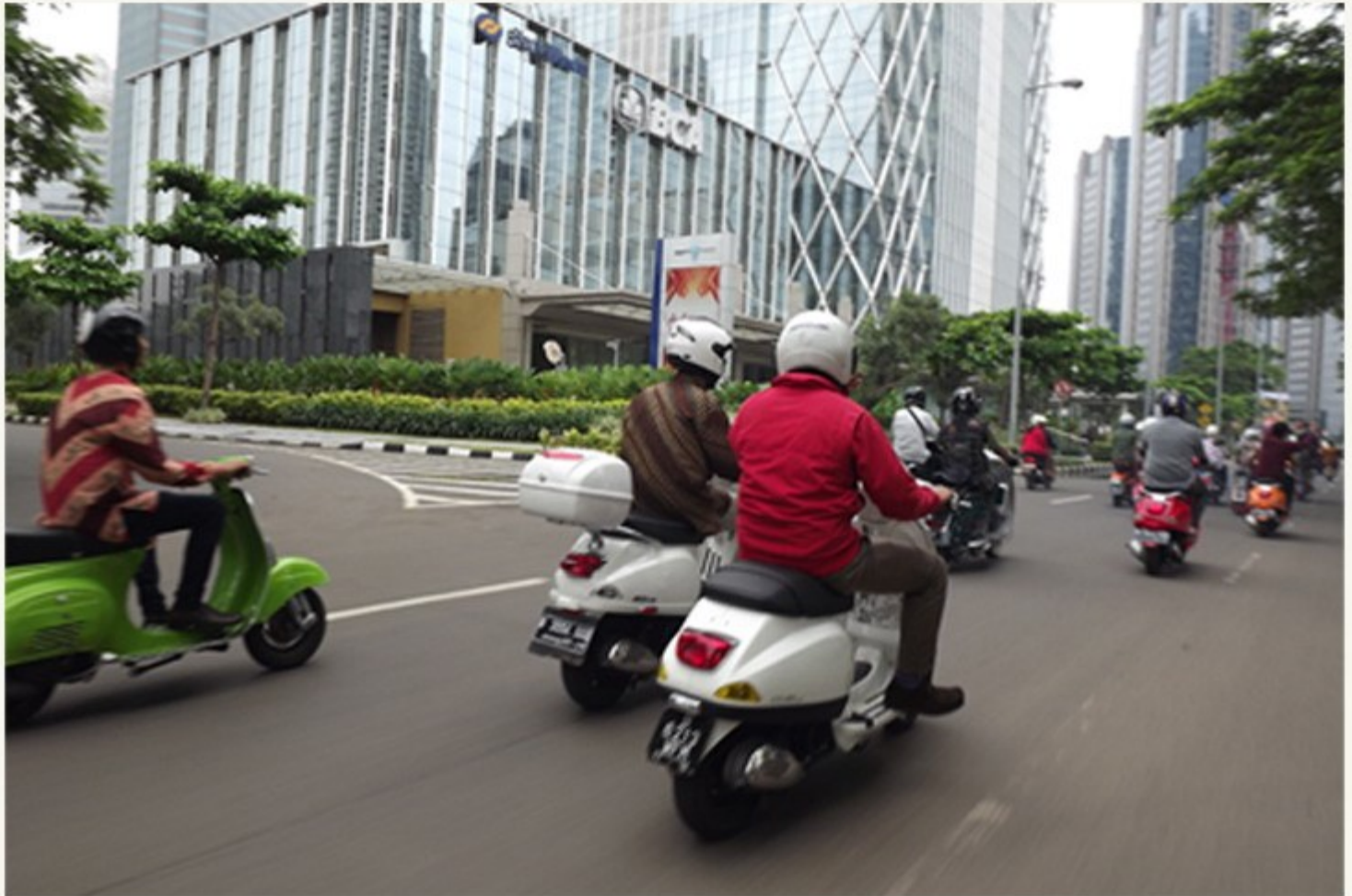
Sebuah pemandangan di Jakarta saat rombongan skuter lawas dan modern melakukan skuteran bersama.

Hal yang sama juga dikatakan oleh Anwar Rizza Ija bahwa ada unsur politis dalam kebijakan tersebut mengingat sesungguhnya penyumbang polusi terbesar di dunia justru dari