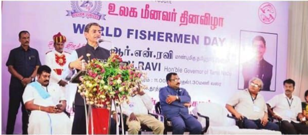
தூத்துக்குடியில் செவ்வாய்க்கிழமை நடைபெற்ற உலக மீனவர் தின விழாவில் பேசிய ஆளுநர் ஆர்.என். ரவி.